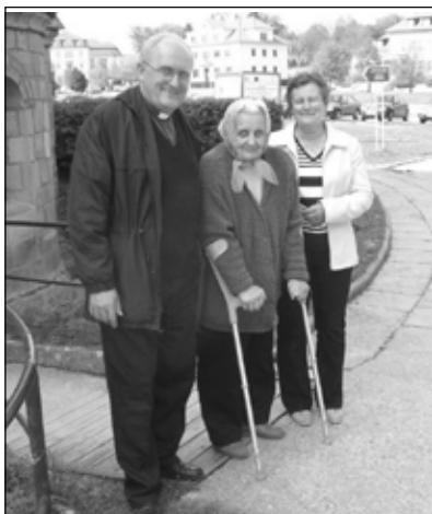
S maminkou a sestrou na Velehradě

tak jednoduché, jak to vypadá. Za tím stál nátlak a vyhrožování místních komunistických orgánů, kterého jsem byl mnohdy sám jako dítě svědkem, a postavit se tomu nebylo snadné. Mám jednu mladší sestru, která je nyní v částečném invalidním důchodě a zároveň se stará o naši devadesátiletou maminku.