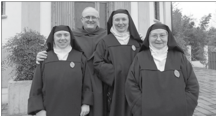
Monteluro - vizitace poustevnic

Jak už jsem řekl, funkce generálního prokurátora je funkce „rezidenční“, tedy, že by se měl zdržovat v Římě. Historicky to bylo dokonce tak, že vzhledem k tomu, že generál hodně cestoval, a to při tehdejších možnostech dopravy trvalo značně dlouho, prakticky byl neustále na cestách. A tak v Římě ho v době jeho nepřítomnosti zastupoval prokurátor a jeho jménem vyřizoval všechny záležitosti. Dnes může být funkce prokurátora spojena s jinými úkoly, jako třeba v mém případě, kdy jsem byl delegátem pro sestry a laiky. Tyto funkce zase cestování vyžadují, protože mnohé věci nelze řešit od „zeleného stolu“, ale je třeba vidět je přímo na místě, mluvit s lidmi. A tak se obtížně hledala rovnováha. Takže já jsem sice cestoval, ale ne mnoho, spíš když bylo něco třeba urgentně řešit nebo vizitovat některé